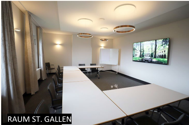
RAUM ST. GALLEN